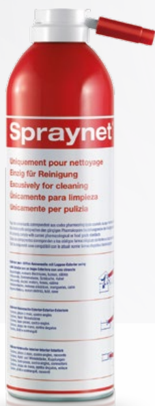
SPRAYNET 500 ml, spray de limpieza Embalaje de 6 unidades REF. 1600036-006