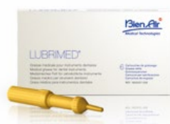
LUBRIMED Embalaje de 6 cartuchos REF. 1600037-006