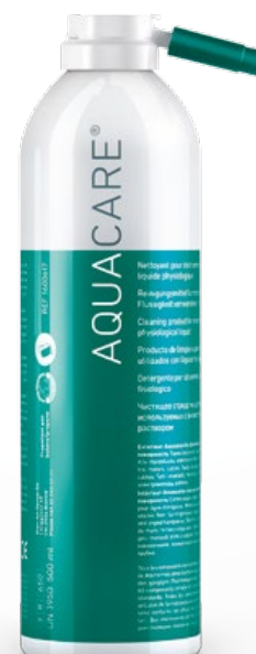
AQUACARE 500 ml, spray de limpieza Embalaje de 6 unidades REF. 1600617-006