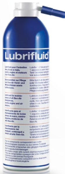
LUBRIFIUID 500 ml, lubricante Embalaje de 6 unidades REF. 1600064-006